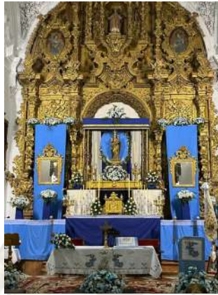
Miguel Ángel Jiménez