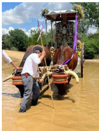
Archivo de Hermandad